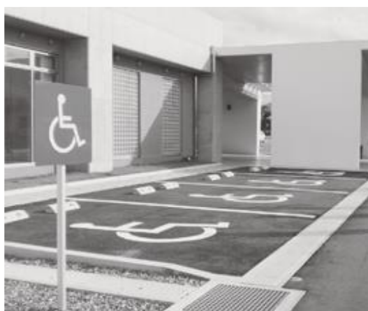
(さくらアリーナ 駐車場)

障がい者等用駐車スペース とは、歩行困難な人等が、施設等を利用しやすいように、入口の近くに設けられたスペースの広い駐車場です。施設によっては、スロープや屋根が設置されています。車いすを利用されている人などは、車から乗り降りするときなどに大きく扉を開けるため、ゼブラ柄の広いスペースが必要です。