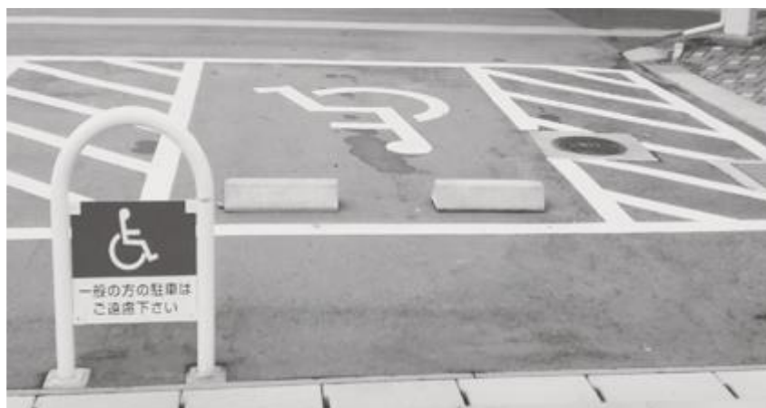
(五泉市役所 本庁舎駐車場)