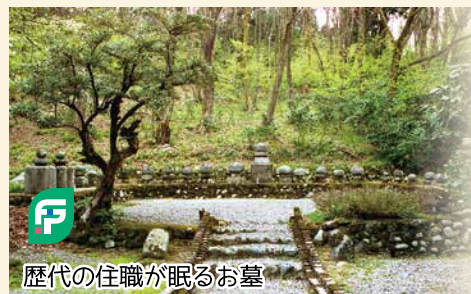
歴代の住職が眠るお墓