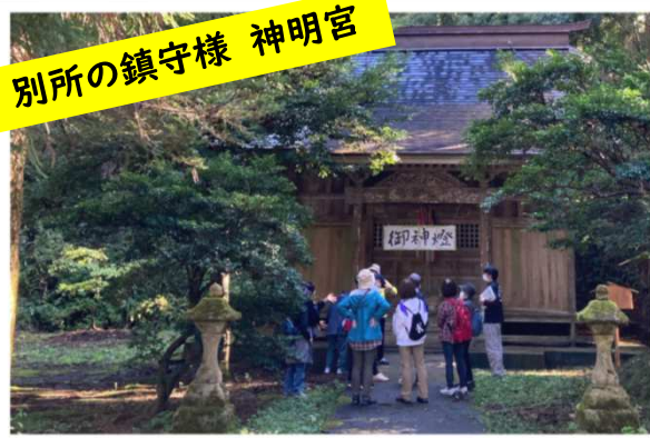
別所の鎮守様 神明宮