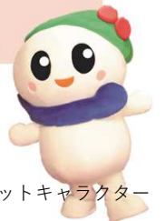
五泉市マスコットキャラクター いずみちゃん

その他、寄附を行うことにより、地域貢献企業としてのPR効果・SDGsへの貢献、地方公共団体との新たなパートナーシップの構築、地域資源などを活かした新たな事業展開などメリットがあります。寄附をご検討される企業様は、五泉市企画政策課までご連絡をお願いします。