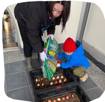
球根を並べ終わったら、土を被せていきます。