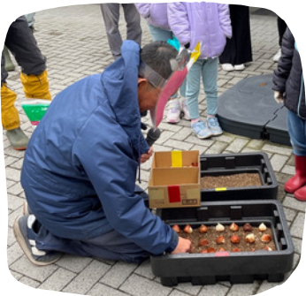
最初に球根の植え方をレクチャーして頂きました。