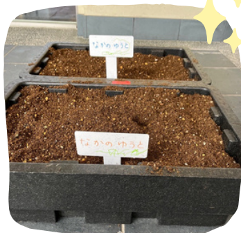
球根を植えた二つのプランターにプレートを挿して完成☆