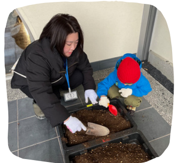
被せた土をシャベルでならします。