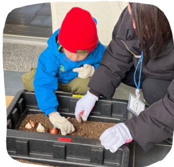
私たちも挑戦。球根の向きに気をつけて植えていきます。