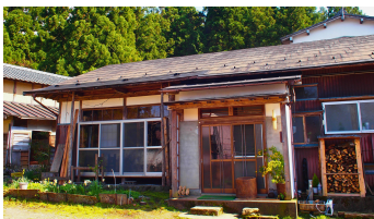
五泉ゲストハウス五ろり