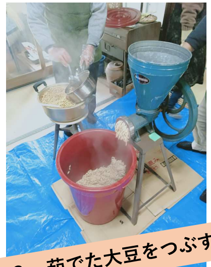
2. 茹でた大豆をつぶす