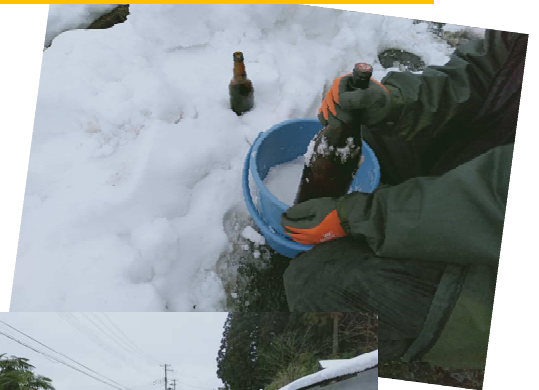
別所地区共同作業 ～雪灯ろう作り～