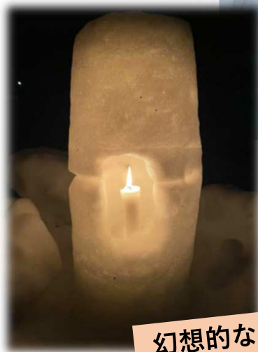
幻想的な光景に心癒されます