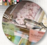
土日限定ジェラート