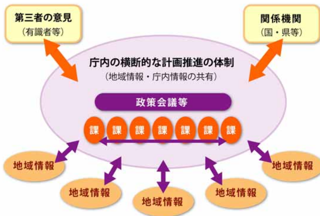
図．庁内の横断的な計画推進体制

また、今後の社会情勢の変化に伴う新たな課題や、都市づくりに関わる各主体との連携により都市づくりを円滑かつ効率的に進めていくために、庁内での人材育成に努めるものとします。