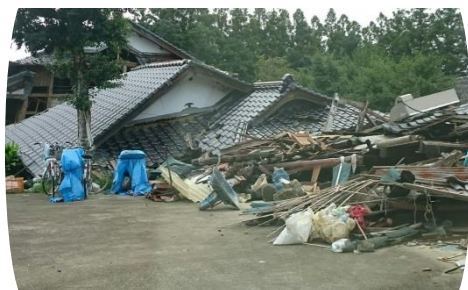
熊本地震:熊本県益城町(H28.7撮影)

昭和56年5月以前に建設された家屋は、耐震性が低く災害時に倒壊など大きな被害を受ける可能性があります。