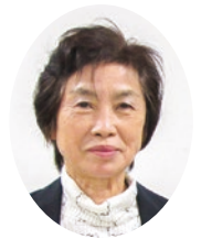
五泉市農業委員会