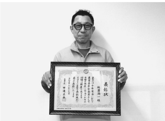
表彰を受けた地濃推進委員