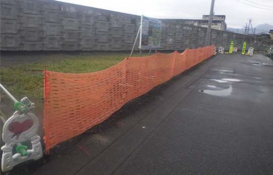
ネットフェンス (施工範囲(外周) 囲む)