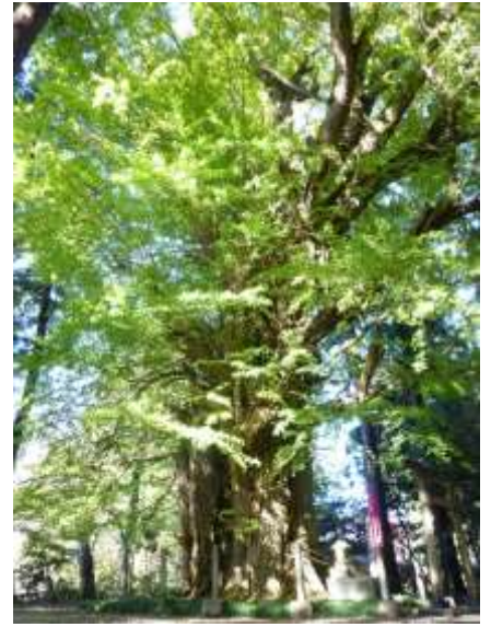
切畑の乳銀杏 (県指定天然記念物)