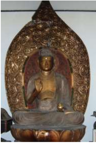
薬師如来仏 (市指定有形文化財)