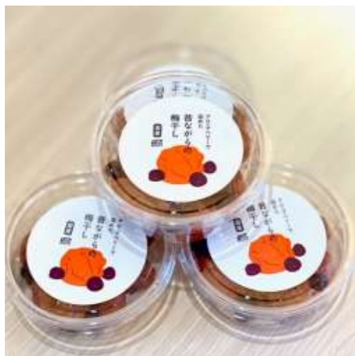
「アロニアベリーで染めた昔ながらの梅干し」 (株)サンファーム泉