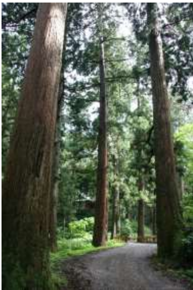
慈光寺のスギ並木 (県指定天然記念物)