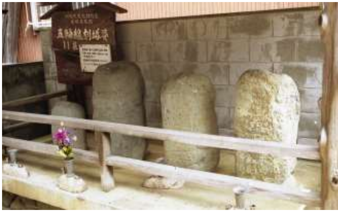
五輪線刻塔婆(市指定有形文化財)