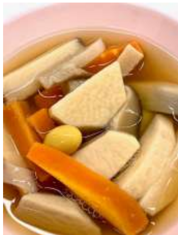
「のっぺ缶」 (株)ヒカリ食品