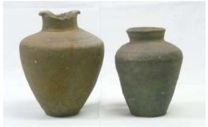
骨蔵器(市指定有形文化財)