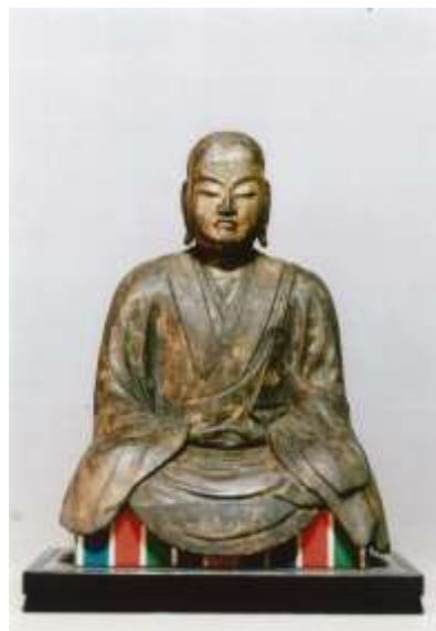
木造僧形文殊菩薩坐像 (市指定有形文化財)