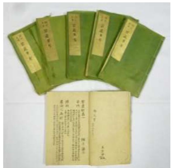
(伝)南英謙宗真筆碧巖事考 (市指定有形文化財)