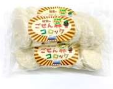
「ごせんコロッケ」 ラポルテ五泉 産直メルカート五泉