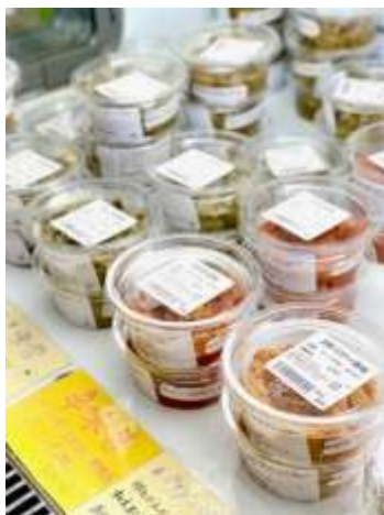
「おかず味噌」 嫁っ子本舗2