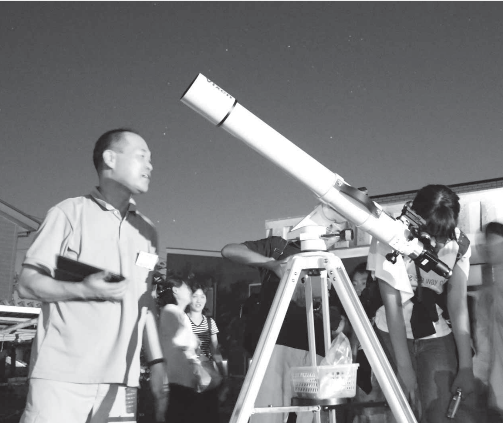
(夏休み子ども講座 村松公民館) ～表紙の話は12ページ～