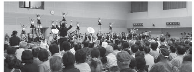
※写真は昨年の明治大学応援団の様子です

日時 9月2日 午後1時30分開場、2時開演、4時20分終演 会場 総合会館 中ホール 入場料 無料 また、成果発表会に先立ち、法政大学応援団が市内をパレードする予定です。コースや時間などの詳細は8月25日号でお知らせします。