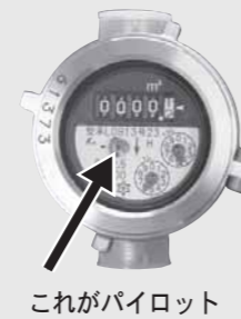
これがパイロット

上下水道局からのお知らせ 月に1度は、漏水の確認を 家の水道が漏水しているようだと思ったら、水道メーターを確認してください。水道の蛇口を全部閉めても水道メーターのパイロットが回っている場合は、漏水の可能性があります。