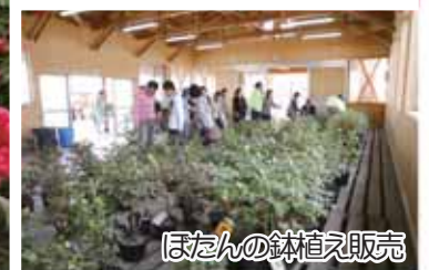
ぼたんの鉢植え販売