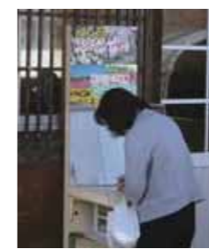
△花シリーズ会場に来たら、スタンプラリーに参加しよう!