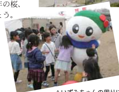
△いずみちゃんの周りには子どもたちが大集合。