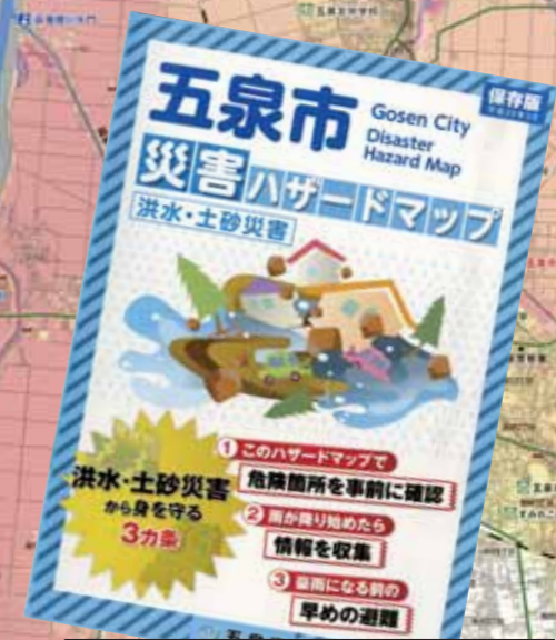
◎今回の広報と一緒に配布します。また、市ホームページにも掲載しています。

災害ハザードマップ 説明会を開催します ＜日時・会場＞ 5月15日 午後7時～ 福祉会館3階 大会議室 5月16日 午後7時～ 村松支所1階 会議室1・2 5月20日 午前10時～ 福祉会館3階 大会議室 午後1時～ 村松支所1階 会議室1・2 ※参加する際は、申し込みは不要ですが、配布した五泉市災害ハザードマップを持参ください。 ※説明会は、1時間程度を予定しています。