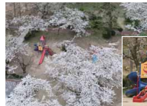
△上空から見た桜も見事。日中は遊具から子ども達の遊び声が。