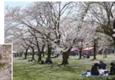
△のんびりとお花見をしていました。