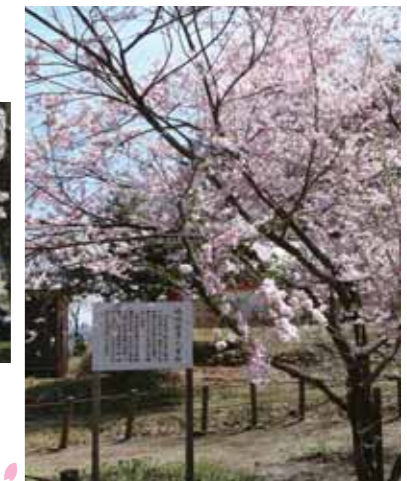
△珍しい穂咲彼岸八重桜も可憐な花を咲かせていました。