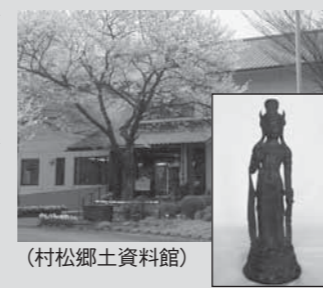
(村松郷土資料館) (銅造観音菩薩立像)