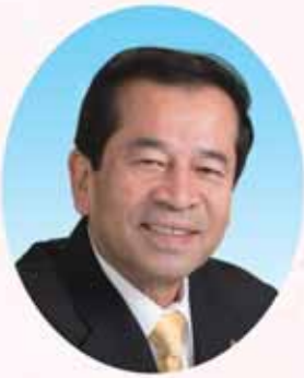
五泉市議会議長 林 茂

つてきたものと感じております。このように、多くの皆さまから大きな後押しを受けて進めてまいりましたまちづくりが、着実に実を結んでおります。この取り組みがさらに進展し、本市がより魅力と活力のあるまちへと発展を遂げるためにも、引き続き皆さまのお力をお寄せいただきたいと思います。