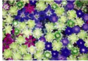
『花模様』 川瀬忠司(曙町)