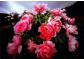
『花簪』 林 寛(本堂)