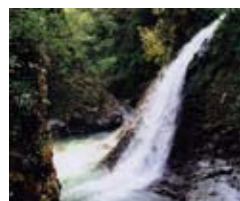
『杉川溪谷春』 井田伸一(搦屋小路)