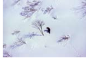
『ひとりぼっち』 大河原 晃(東本町1)