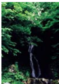
『新緑と夫婦滝』 五十嵐美衛(新潟市)