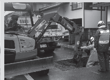
▲水道管の漏水を修繕（新潟市西区）