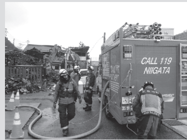
▲緊急消防援助隊（石川県輪島市）

市では、能登半島地震で大きな被害が生じた石川県をはじめ被災地からの応援要請を受け、各地へ職員を派遣しました。