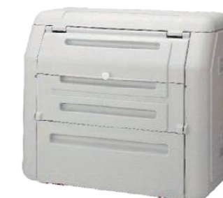
ペットボトル拠点回収ボックス