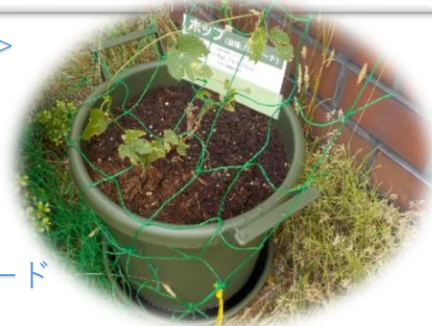
ホップ → 品種カスケード