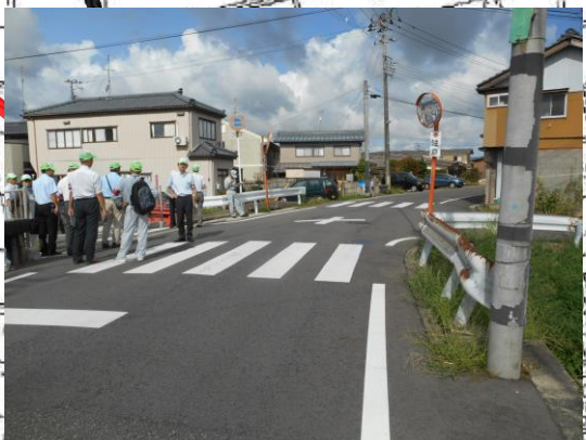
平成29年度②ドットライン表示完了