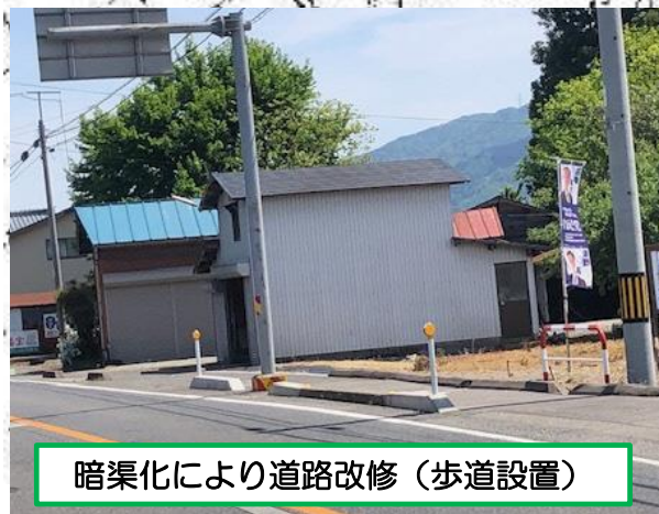
暗渠化により道路改修（歩道設置）