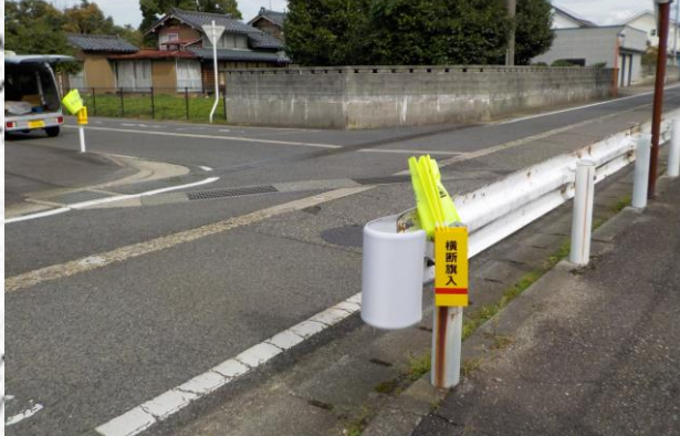
平成30年度⑤横断旗の設置完了