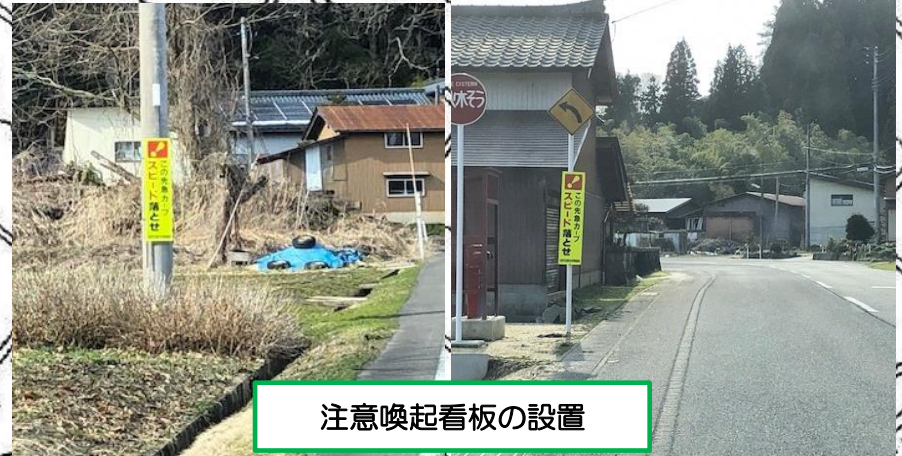
注意喚起看板の設置