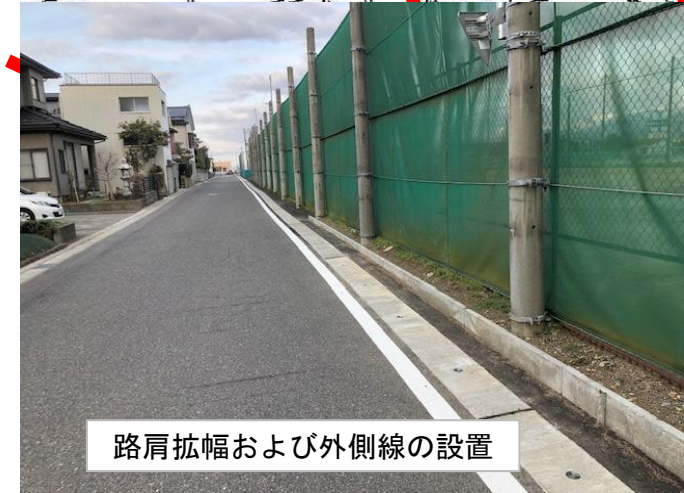
路肩拡幅および外側線の設置

《対策メニュー》 ①路肩拡幅および外側線の設置【都市整備課】 (令和5年度対策完了) 《備考》 ・高校用地との境界なども確認し、実施内容を検討