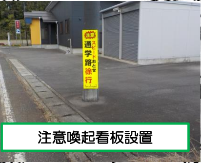
注意喚起看板設置