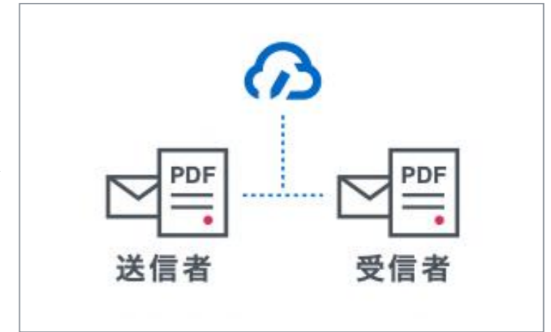
締結後書類を印刷・PDFで保管