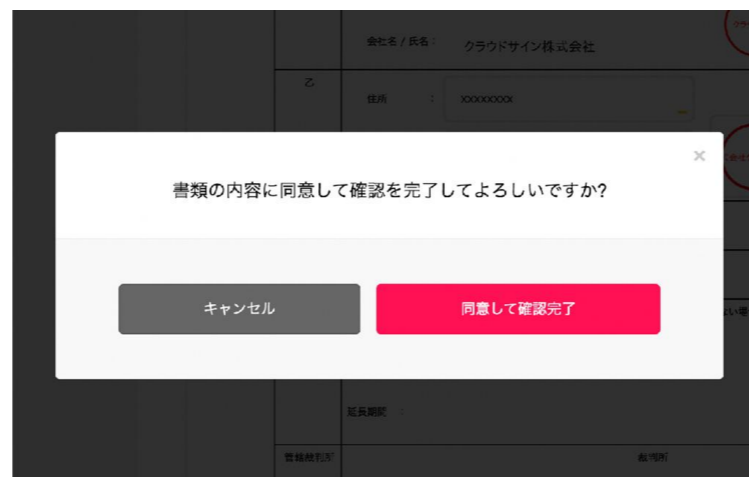
契約書確認・合意